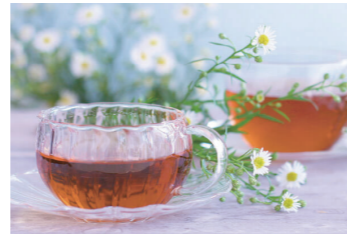
紅茶に入れたらほんのりゆずの香るジンジャーティーに