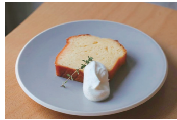
お菓子作りの原料やかき氷のシロップにも！