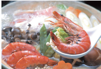
お鍋や魚・肉料理 なんでも合います