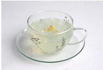
いつでもどこでも「香りのゆず」を手軽に楽しめます