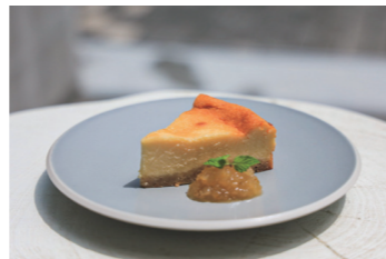
スイーツのアレンジにも最適です