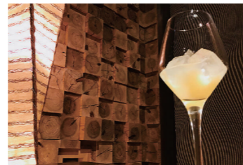
ロックや日本酒割などお好みの飲み方

販売先 外食産業 (居酒屋、アイス屋、パンケーキ屋、レストラン) 食シーン そのままグラスへ注ぎソフトドリンクとして。アルコールで割ってカクテルとして。幅広い世代の方にお楽しみいただけます。