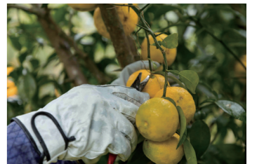
高知県産のゆずを栽培から加工まで自社で行っています