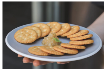
クラッカーに乗せて簡単おやつに