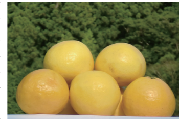
高知県産の小夏果汁 100%