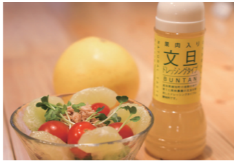
さっぱりとした味わいが、新鮮な野菜のおいしさを引き立てます。