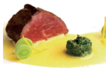
お鍋だけじゃなくお肉にもぴったり