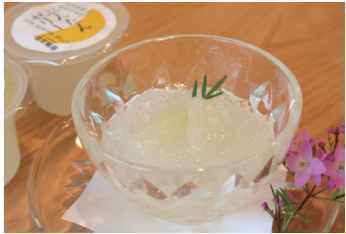
プリプリ×とろとろ食感をお楽しみください