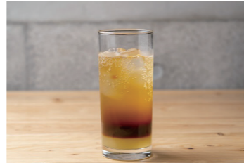
柑橘コーヒースーザ、オリジナルドリンクを作ってみませんか