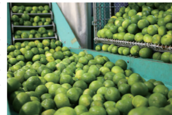
直七の搾汁風景 自社工場で行っています