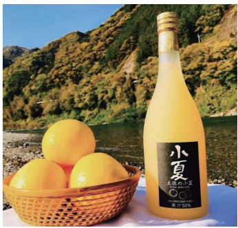
小夏らしい甘酸っぱさと、さっぱりとした後味を感じられます