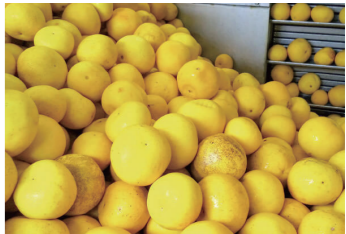
おいしい、あんしん。を目指して、国産原料 100%と無添加でつくっています。