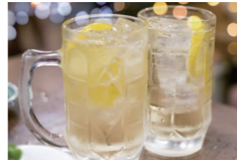
お酒やソフトドリンクの割り材に

販売先 外食産業（居酒屋、アイス屋、パンケーキ屋、レストラン） 食シーン 6倍希釈のシロップ材です。水や炭酸で割って、ソフトドリンクに。お酒で割ったら、サワーやカクテルに早変わり。キャンプやパーティでも大活躍！