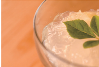
土佐文旦を手軽においしく