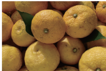
自社工場ではばってます