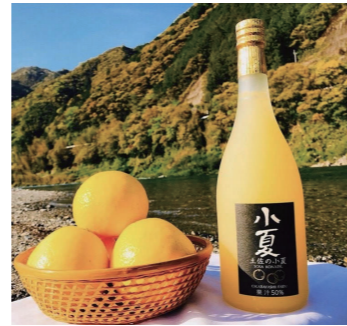
小夏らしい甘酸っぱさと、さっぱりとした後味を感じられます

販売先 外食産業 (居酒屋、アイス屋、パンケーキ屋、レストラン) 食シーン そのままグラスへ注ぎソフトドリンクとして。アルコールで割ってカクテルとして。幅広い世代の方にお楽しみいただけます。