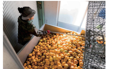
すっきりとした酸味に、ほのかなほろ苦さ