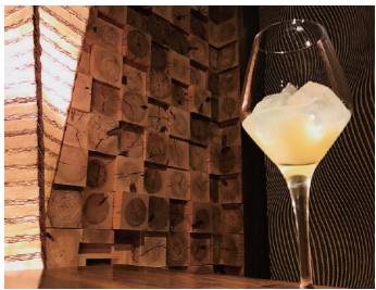
ロックや日本酒割など好みの割り方で