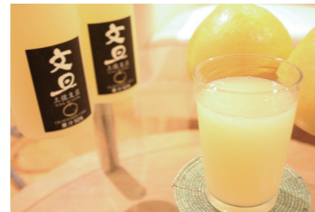
土佐文旦の上品な味わいを贅沢に味わえます

販売先 外食産業 (居酒屋、アイス屋、パンケーキ屋、レストラン) 食シーン そのままグラスへ注ぎソフトドリンクとして。アルコールで割ってカクテルとして。幅広い世代の方にお楽しみいただけます。