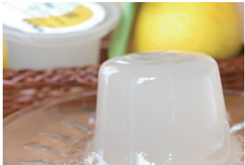
小夏の爽やかさを柔らかなゼリーと共に