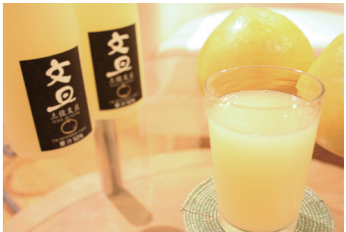
土佐文旦の上品な味わいを贅沢に味わえます