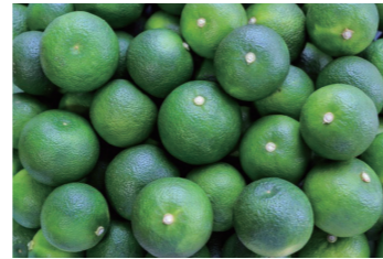
直七果汁 100% 自社工場で作っています

販売先 外食産業 (居酒屋、アイス屋、パンケーキ屋、レストラン) 食シーン そのままグラスへ注ぎソフトドリンクとして。アルコールで割ってカクテルとして。幅広い世代の方にお楽しみいただけます。