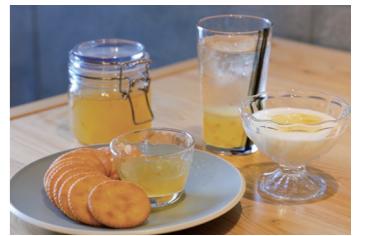
ヨーグルトのソースや焼き菓子のアレンジにも大活躍

販売先 外食産業 (居酒屋、アイス屋、パンケーキ屋、レストラン) 食シーン 6倍希釈のシロップ材です。水や炭酸で割って、ソフトドリンクに。お酒で割ったら、サワーやカクテルに早変わり。キャンプやパーティでも大活躍！