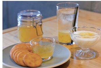
ヨーグルトのソースや焼き菓子のアレンジにも大活躍