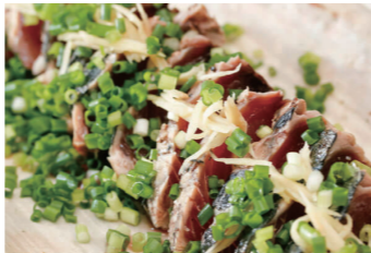
軽のタタキや肉料理とも相性抜群！