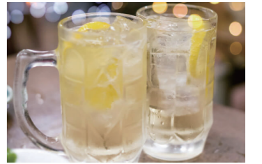
お酒やソフトドリンクの割り材に