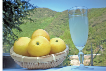
爽やかな酸味と味わい