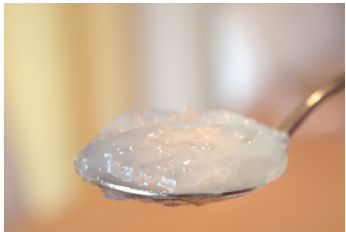
ひとくちで口の中にゆずが香ります