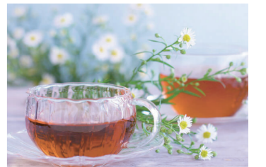
紅茶に入れば柚子ジンジャーティーに