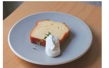
お菓子作りの原料やかき氷のシロップにも！

販売先 外食産業 (居酒屋、アイス屋、パンケーキ屋、レストラン) 食シーン 4倍希釈のシロップ材です。水や炭酸で割って、ソフトドリンクに。お酒で割ったら、サワーやカクテルに早変わり。キャンプやパーティでも大活躍！