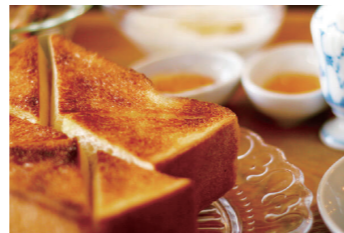
焼きたてパンとも相性抜群

販売先 外食産業（居酒屋、アイス屋、パンケーキ屋、レストラン） 食シーン パンやヨーグルト、アイスクリームのトッピングに。トーストやクラッカーとも相性抜群です