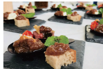
パンやヨーグルトだけでなくお料理のソースにも使えます

販売先 外食産業（居酒屋、アイス屋、パンケーキ屋、レストラン） 食シーン パンやヨーグルト、アイスクリームのトッピングに。トーストやクラッカーとも相性抜群です