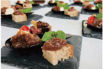
パンやヨーグルトだけでなくお料理のソースにも使えます