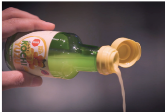
高知県産ゆず 100% 使用