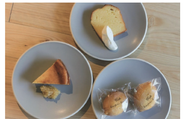
スイーツの原料にオススメです。爽やかな柑橘の風味が広がります